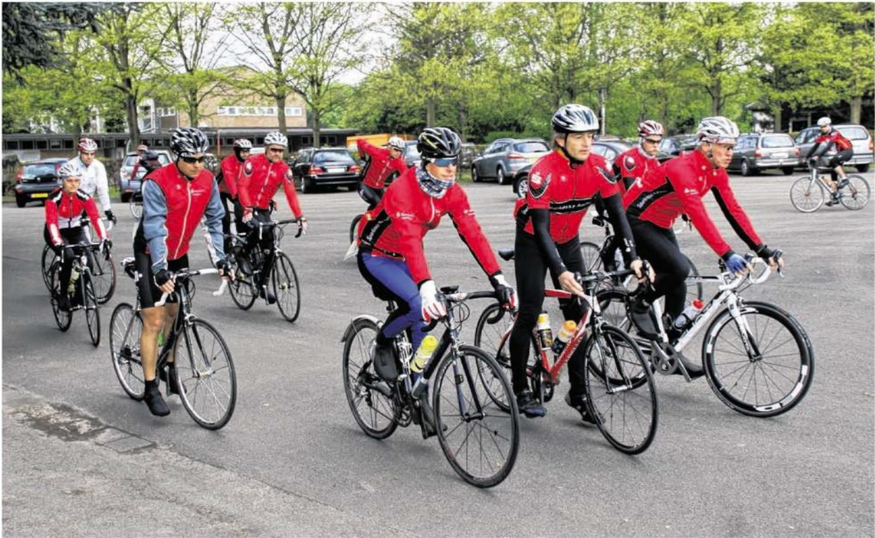
Und los: Zur „Noppis-Jubiläumsrunde“ gingen insgesamt 420 Teilnehmer an den Start. 'Aachener-Zeitung 30.04.2014